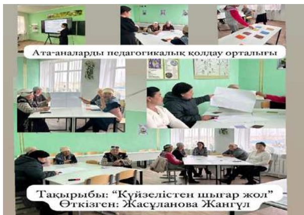
Ата-аналарды педагогикалық қолдау орталығы

Жангүл https://www.instagram.com/p/C5n7KhsINZr/?igsh=MTc4MmM1Yml2Ng==